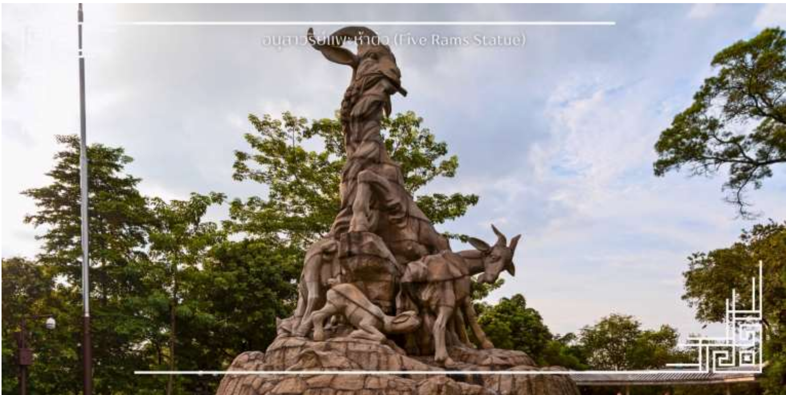
อนุสาวรีย์แพะห้าตัว (Five Rams Statue)

นำท่านถ่ายรูปเช้คอินสวนสาธารณะเยอเซี่ยวซึ่งเป็นสวนสาธารณะขนาดใหญ่ที่สุดในเมืองกวางโจว และนำท่านชมอนุสาวรีย์แพะห้าตัว นับว่าเป็นอีกแลนด์มาร์กกวางโจว สัญลักษณ์ของแพะห้าตัวคาบรวงข้าว 6 รวง เป็นสัญลักษณ์ประจำเมืองกวางโจวมีการแกะสลักด้วยหินแกรนิตอย่างสวยงาม และบริเวณโดยรอบยังมีกิจกรรมการรำไทเก๊กของผู้สูงอายุและคนในชุมชนกวางเจาภายใต้บรรยากาศของสวนสาธารณะที่ร่มรื่น จึงเป็นที่พักผ่อนหย่อนใจได้ทั้งนักท่องเที่ยวและผู้คนในกวางโจวได้ดีเลยทีเดียว