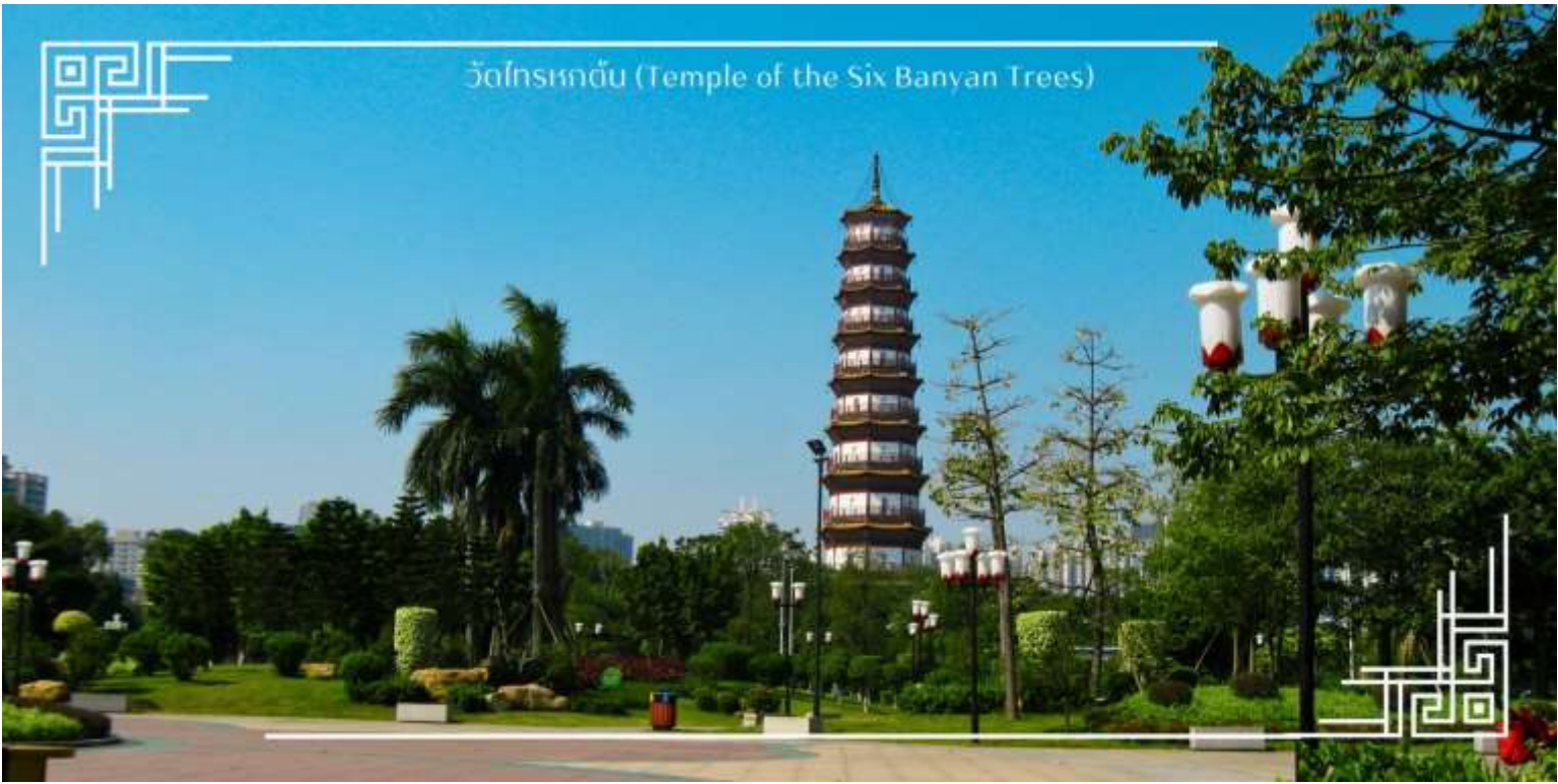
วัดพระกษัตริย์ (Temple of the Six Banyan Trees)

นำท่านถ่ายรูปเช้คอินสวนสาธารณะเยอเซี่ยวซึ่งเป็นสวนสาธารณะขนาดใหญ่ที่สุดในเมืองกวางโจว และนำท่านชมอนุสาวรีย์แพะห้าตัว นับว่าเป็นอีกแลนด์มาร์กกวางโจว สัญลักษณ์ของแพะห้าตัวคาบรวงข้าว 6 รวง เป็นสัญลักษณ์ประจำเมืองกวางโจวมีการแกะสลักด้วยหินแกรนิตอย่างสวยงาม และบริเวณโดยรอบยังมีกิจกรรมการรำไทเก๊กของผู้สูงอายุและคนในชุมชนกวางเจาภายใต้บรรยากาศของสวนสาธารณะที่ร่มรื่น จึงเป็นที่พักผ่อนหย่อนใจได้ทั้งนักท่องเที่ยวและผู้คนในกวางโจวได้ดีเลยทีเดียว