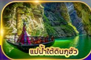
แม่น้ำใต้ดินกุ้อว