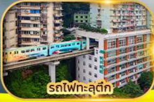
รถไฟฟ้า-สุดึก