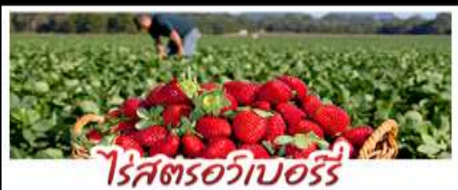
ไร้สตรอเบอร์รี่

คฤหาสน์เหวินเจิง - สวนซากุระชิงต้า ไร้สตรอเบอร์รี่ - โรงเบียร์ชิงต้า