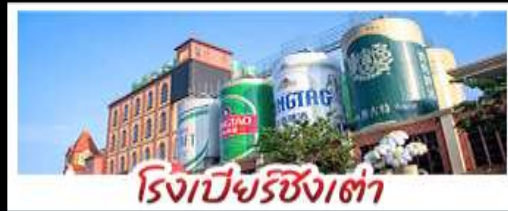
โรงเบียร์ชิงต้า