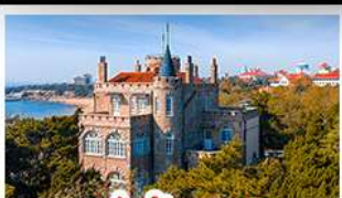
ป่าตักกวน

พระราชวังฤดูร้อน - วิวเมืองซิงเต่า รถไฟความเร็วสูง - ภูเขาเหลาซาน กำแพงเมืองจีนด้านจวียงกวน - ป่าตักกวน พักโรงแรมระดับ 4 ดาว - ไม่ลงร้านซื้อ มือพิเศษ เปิดปักกิ่ง , หม้อไฟซีฟู้ด