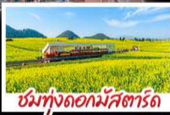
ชมทุ่งดอกไม้สตาร์ด