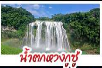
น้ำตกหวงกู่ชู่

สะพานหุบเขาฮวาเจียง สะพานแขวนที่ยาวที่สุดในโลก ปราสาทจิงหลงเป่า - หมู่บ้านแม้วฮวาเจียง เที่ยวชิวชมทุ่งดอกไม้สตาร์ดและดอกซากุระ ล่องเรือทะเลสาบหวิ่นเฟิงหู - น้ำตกหวงกู่ชู่ พักโรงแรมระดับ 4 ดาว - ชมหอเจียวไหลว เมนูปลาต้มซูปเปริยาว - ไม่ลงร้านซื้อ