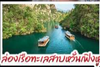
ล่องเรือทะเลสาบหวิ่นเฟิงหู