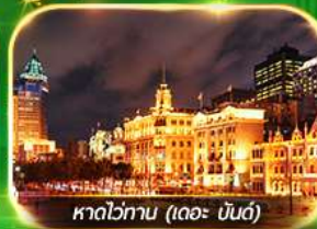
หาดว่ทาน (เดอะ บันด์)

เที่ยวมหานครเซี่ยงไฮ้ ถ่ายรูปเช็คอินท์ Tian An 1000 Trees, ซินเทียนตี้ ช้อปปิ้งตลาดเงินหวงเหมียว, ถนนนานกิง