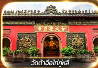
วัดต้าจื่อไท่กุหลี่