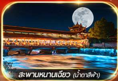
สะพานหนานเจียว (น้ำตาสีฟ้า)