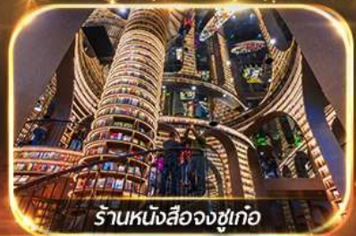
ร้านหนังสือจงซูเท๋อ

เที่ยวชมทัศนียภาพ 2 อุทยาน บีเฟิงโกว & ชวงเจียวโกว