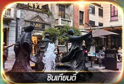
ซินเทียนตี้