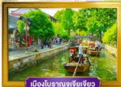
เมืองโบราณซูโจว