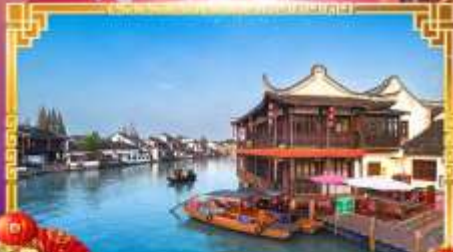
เมืองโบราณซูเจียเจียว