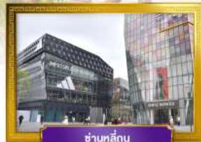
ชานหลู่กุน