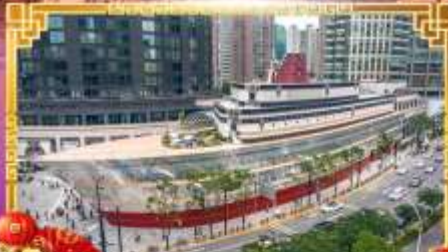
เรือหลุยส์วิคตอง