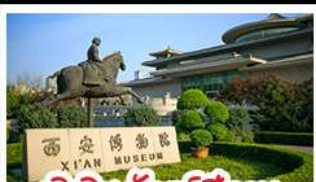
พิพิธภัณฑ์ซีอาน