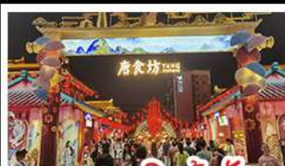
ถนนคนเดินต้าถิง