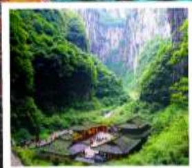
หลุมฟ้าสะพานสวรรค์