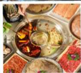
หม้อไฟหมาล่า