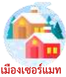
เมืองเซอร์แมท

เช้า บริการอาหารเช้า ณ ห้องอาหารของโรงแรม (11)