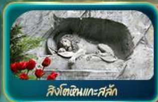
สิงโตหินแกะสลัก