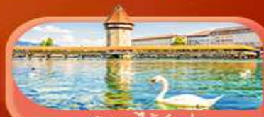
สะพานไม้ซังปก

Highlight เยือนหมู่บ้านแสนสวยเซอร์แมท เช็กอินศาลาไทยสุดงามที่โลซาน เที่ยวลูเซิร์น ชมสะพานไม้ซังและอนุสาวรีย์สิงโต ซาลี แอปสทิน ชมประติมากรรม The Fork และปราสาทซิลลองริมทะเลสาบ เยือนมิลาน มหาวิหารดูโอโม เที่ยวเวนิส เมืองลอยน้ำสุดโรแมนติก อินกับรักอมตะที่บ้านจูเลียต และช้อปปิ้งจุใจที่ Serravalle Outlet