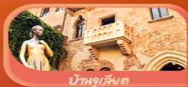
บ้านจูเลียต