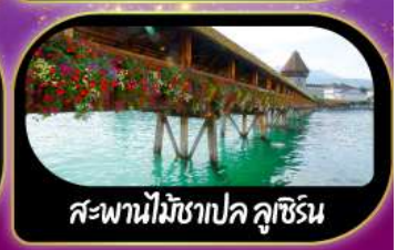
สะพานไม้ชาปค ลูซิิร์น