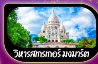
วิหารสกรทอร์ มงมาร์ต