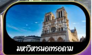
มหาวิหารนอทรอดาม