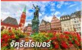
จัตุรัสสโมธอร์