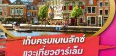
เก็บครบเบเนลักซ์ แวะเที่ยวฮาร์เล็ม