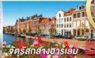
จัตุรัสกลางฮาร์เล็ม