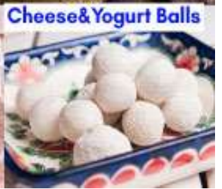
Cheese & Yogurt Balls